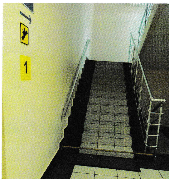
Лестница с поручнями