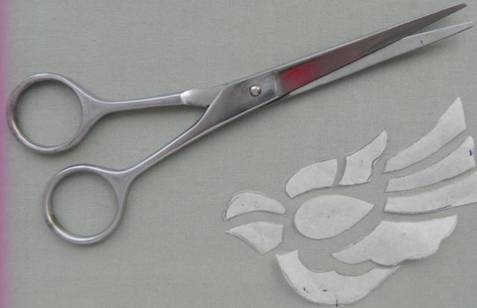
Рисунок разрезать на элементы для использования в качестве выкройки деталей.